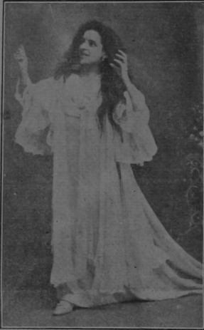
La Soprano señora Lidia Levy, quien alcanzó un ruidoso triunfo anoche en el país de la locura de Lucha.

El público, en un desborde de entusiasmo aplaudió á la artista que unió á sus virtuosos con el agigantamiento de una alma loca, resultando vivida tan conmovedora escena.